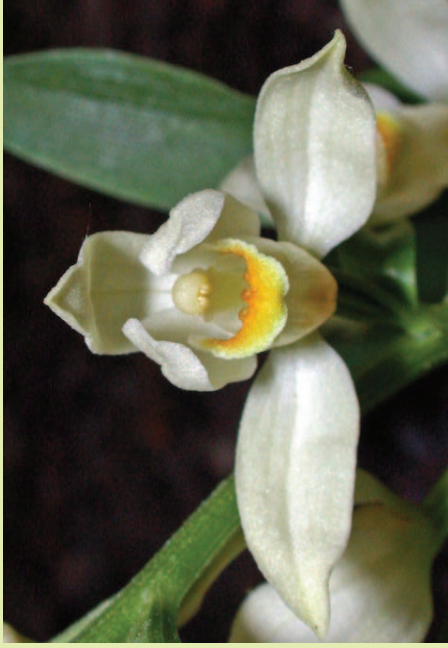
Nicht häufig zu beobachten: weit geöffnete Blüte

Die Pflanzen verfügen über ein reich verzweigtes, fast waagrecht verlaufendes Rhizom (unterirdische Sprossachse), das bewurzelt ist. Sie erreichen Höhen bis etwa 60 cm. Die drei bis sechs, eiförmig zugespitzten, grünen Laubblätter stehen wechselständig an der Achse. Die spornlosen Blüten werden von fünf gleichmäßig weiß-bis elfenbeinfarbenen und sich ähnelnden Kronblättern bestimmt, von der sich nur die zweigliedrige, oberseits goldgelbe Lippe abhebt. Sie ist in einen bauchig erweiterten, hinteren Abschnitt mit zwei sichelförmigen Lappen und einen dreieckig-herzförmigen, mit drei Leisten ausgestatteten vorderen Abschnitt gegliedert.