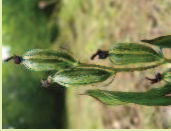
li.: Fruchtende Pflanzen mit einem chlorotischen Exemplar; re.: Fruchtkapseln

Nach der aktuellen Roten Liste Deutschlands ist die Art in den meisten Bundesländern nicht gefährdet. Allerdings zeigen sich doch einige Sorgen bereitende Veränderungen dieses Zustandes durch radikale und zerstörerische Waldnutzungsmethoden. Schädigungen können aber auch durch Wildverbiss eintreten. Die Bestandssicherung wird also künftig maßgeblich von einer zuträglichen Waldwirtschaft abhängen. Wichtig ist dabei, dass zahlreiche Altbäume erhalten bleiben, die für das Funktionieren einer benötigten Mykorrhiza (Zusammenleben vieler Landpflanzen mit Pilzen zum wechselseitigen Vorteil), auch für alle anderen Waldorchideen, dringend notwendig sind!