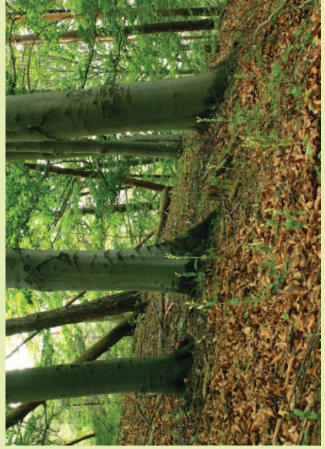
Typisches Biotop: alter Buchenbestand über basischem Untergrund

Der Austrieb erfolgt im Frühjahr. Die Blütezeit reicht von Mitte Mai bis Ende Juni, manchmal bei kühlerem Wetterverlauf bzw. in Hochlagen auch bis in den Juli hinein. Oft wird die Art als Beispiel für Selbstbestäubung, sogar Bestäubung in der Knospe genannt. Dass aber Fremdbestäubung nicht auszuschließen ist, beweisen die, allerdings nicht häufigen, Hybriden mit den beiden anderen heimischen Arten!