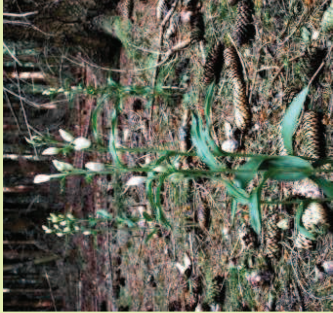
Selbst in lichterarmen Fichtenforsten kann das Weiße Waldvöglein vorkommen

Nach der aktuellen Roten Liste Deutschlands ist die Art in den meisten Bundesländern nicht gefährdet. Allerdings zeigen sich doch einige Sorgen bereitende Veränderungen dieses Zustandes durch radikale und zerstörerische Waldnutzungsmethoden. Schädigungen können aber auch durch Wildverbiss eintreten. Die Bestandssicherung wird also künftig maßgeblich von einer zuträglichen Waldwirtschaft abhängen. Wichtig ist dabei, dass zahlreiche Altbäume erhalten bleiben, die für das Funktionieren einer benötigten Mykorrhiza (Zusammenleben vieler Landpflanzen mit Pilzen zum wechselseitigen Vorteil), auch für alle anderen Waldorchideen, dringend notwendig sind!