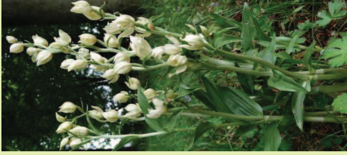
Weißes Waldvöglein Cephalanthera damasonium (MILL.) DRUCE