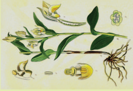
Historische Abbildung der Pflanzenteile (W. MÜLLER 1900)

Die Pflanzen verfügen über ein reich verzweigtes, fast waagrecht verlaufendes Rhizom (unterirdische Sprossachse), das bewurzelt ist. Sie erreichen Höhen bis etwa 60 cm. Die drei bis sechs, eiförmig zugespitzten, grünen Laubblätter stehen wechselständig an der Achse. Die spornlosen Blüten werden von fünf gleichmäßig weiß-bis elfenbeinfarbenen und sich ähnelnden Kronblättern bestimmt, von der sich nur die zweigliedrige, oberseits goldgelbe Lippe abhebt. Sie ist in einen bauchig erweiterten, hinteren Abschnitt mit zwei sichelförmigen Lappen und einen dreieckig-herzförmigen, mit drei Leisten ausgestatteten vorderen Abschnitt gegliedert.