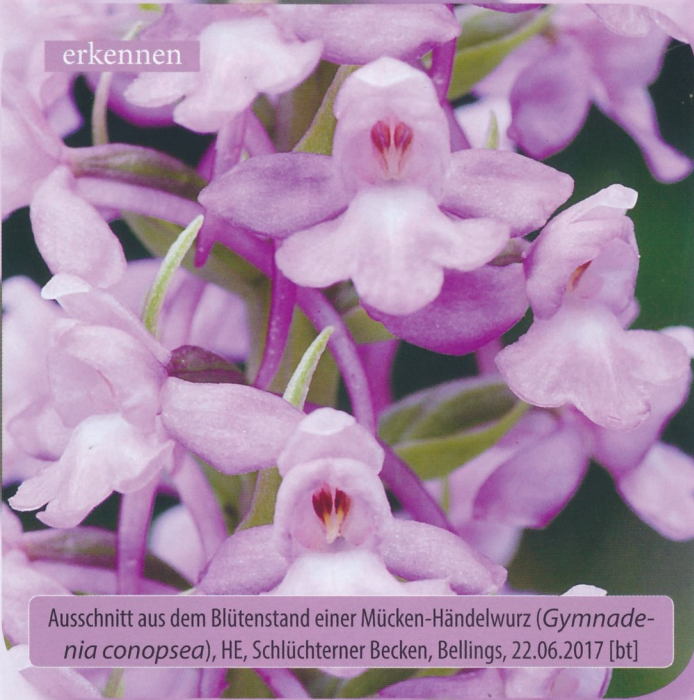
Ausschnitt aus dem Blütenstand einer Mücken-Händelwurz ( Gymnadenia conopsea), HE, Schlüchtern Becken, Bellings, 22.06.2017