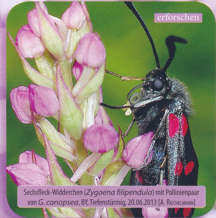
Sechsfleck-Widderchen ( Zygaena filipendula) mit Pollinienpaar von G. conopsea, BY, Tiefenstürmig, 20.06.2013