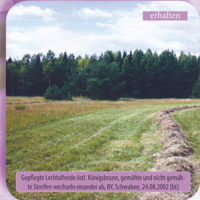
Gepflegte Lechtalheide östl. Königsbrunn, gemähte und nicht gemähte Streifen wechseln einander ab, BY, Schwaben, 24.08.2002